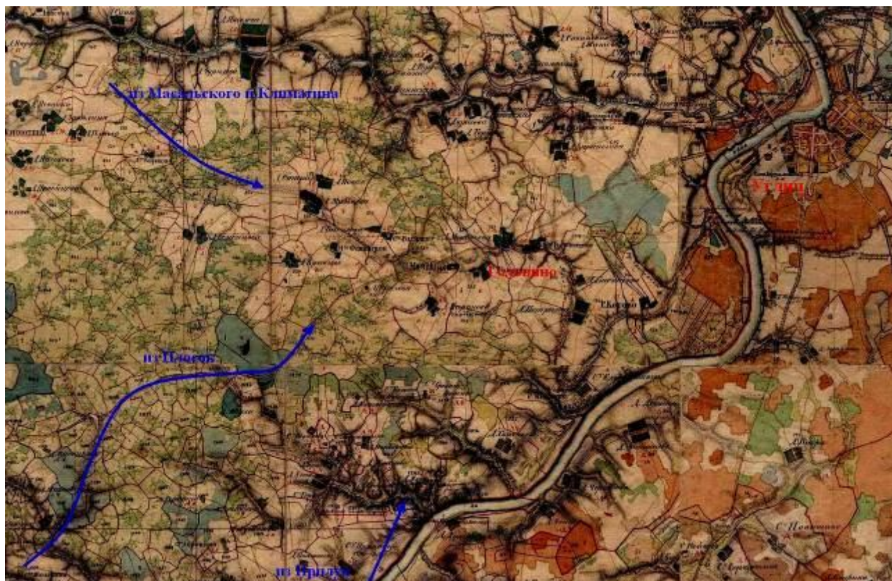
Реконструкция карты боевых действий на Левом берегу. 53

Но положение оказалось куда серьезнее, чем предполагалось: «В Ярославскую Чрезвычайную комиссию. Шлите отряд. Банды... в Плосковской и Климатинской волостях. С нашей стороны есть потери». 51 И ещё, в Мышкин: «Шлите 10 пулеметных лент для пулемета нашей команды, находящейся в г.Угличе». 52